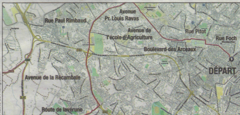
Le parcours dans les rues de Montpellier, ce jeudi (haut) et vendredi (bas).

marches de la Tour Eiffel... à vélo. « Le but du jeu est de progresser sur l'un des six niveaux sans poser le pied par terre. J'ai tout fait pour perturber leur équilibre. A eux de rattraper le coup », sourit-il.